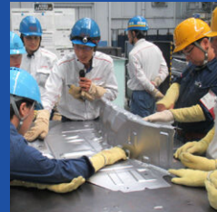
トライ品の不具合洗い出し