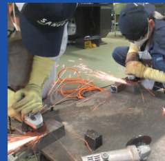
仕上げ作業の練習

受講料 ¥6,000 / 講習 (アークとTIGの両方を受講する場合は¥12,000)