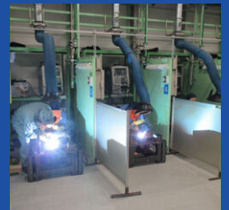
溶接を徹底的に練習