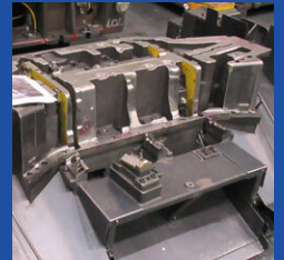
本型を使った実技