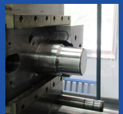
コップの成形トライ